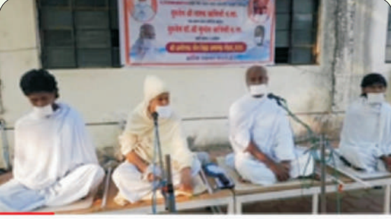
प. पू. श्री. तारकरुषीजी म. सा. व प. पू. डॉ. श्री. सुयोगरुषीजी म. सा. अमोलक परिवारास संबोधित ...