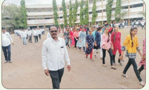
हर घर तिरंगा अभियान