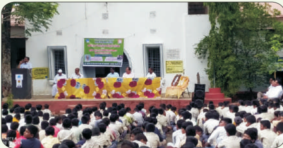
अमोलक- देवराई वर्धापनदिन सोहळा