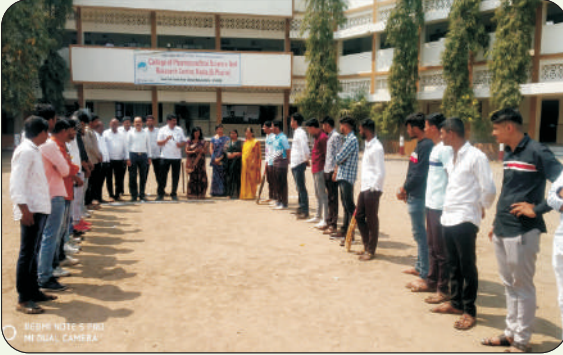
स्नेह संमेलन क्रिकेट स्पर्धा