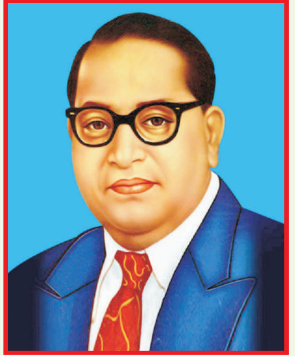
भारतीय राज्यघटनेचे शिल्पकार डॉ. बाबासाहेब आंबेडकर