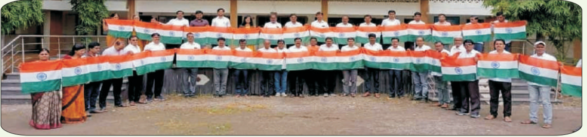
रसायनशास्त्र विभाग व महाविद्यालयातर्फे आयोजित हर घर तिरंगा अभियान