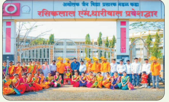
ट्रॅडिशनल डे साजरा करताना विद्यार्थी