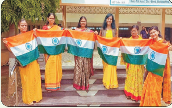
हर घर तिरंगा अभियान