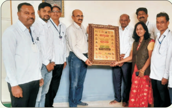
रसायनशास्त्र विभागा माजी विद्यार्थी संघातर्फे महाविद्यालयास जैन धर्म उद्धारक चोवीस तीर्थंकर गोल्डन फ्रेम फोटो भेट