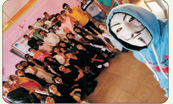
स्नेह संमेलन विविध स्पर्धा