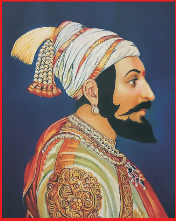
हिंदवी स्वराज्य संस्थापक श्री छत्रपती शिवाजी महाराज