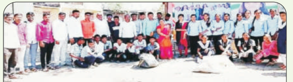
आष्टी तालुक्यातील देवी-निमगाव येथे डॉ. बाबासाहेब आंबेडकर मराठवाडा विद्यापीठ औरंगाबाद आणि कडा येथील श्री अमोलक जैन विद्या प्रसारक मंडळाचे श्रीमती शांताबाई कान्तीलाल गांधी कला, अमलोक विज्ञान, आणि पञ्जालाल हिरालाल गांधी यागिज्य महाविद्यालयाचे राष्ट्रीय सेवा योजनेचे विशेष शिविरामध्ये स्वयंसेवकांनी ग्रामस्वच्छता मोहीम, प्लास्टिक मुक्ती मोहीम, मतदानाविषयी जनजागृती, पर्यावरण जनजागृती इत्यादी कार्ये केले. त्याचबरोबर नव्यांनी गावामध्ये चालविल्याहा विषयक, जलसंधारणाचे महत्त्व इत्यादी बद्दल ग्रामस्थांना मार्गदर्शन केले इत्यादी कार्ये केले.