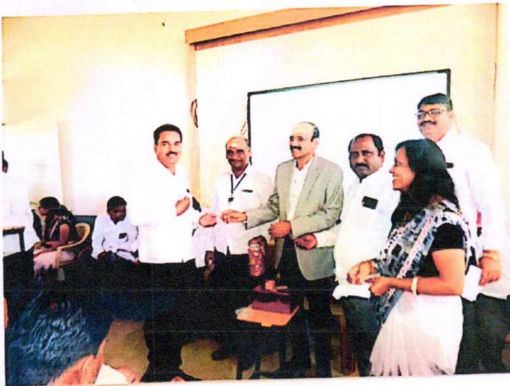
वार्षिक स्नेहसंमेलन 2020 - शेलापागोटे कार्यक्रम संपन्न