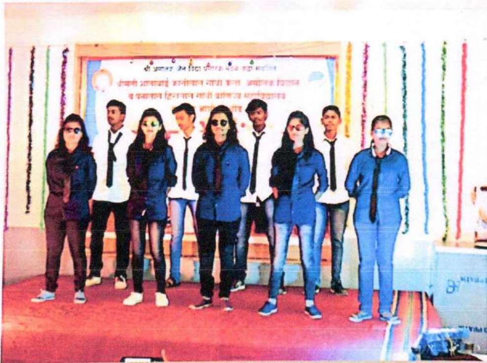
वार्षिक स्नेहसंमेलन 2020 - ग्रुप 3 न्या कला प्रकार सादर करतेवेळी - महाविद्यालयी विद्यार्थी.