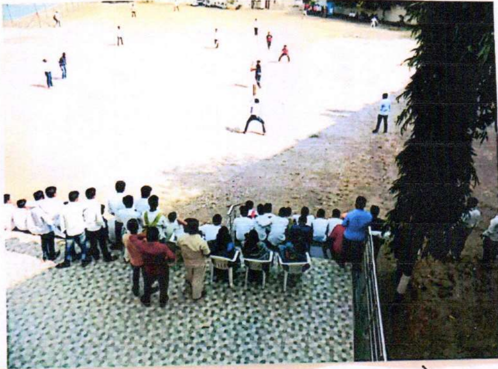
वार्षिक स्नेहसंमेलन 2020 - क्रिकेट स्पर्धेवेली महाविद्यालयचे विद्यार्थी