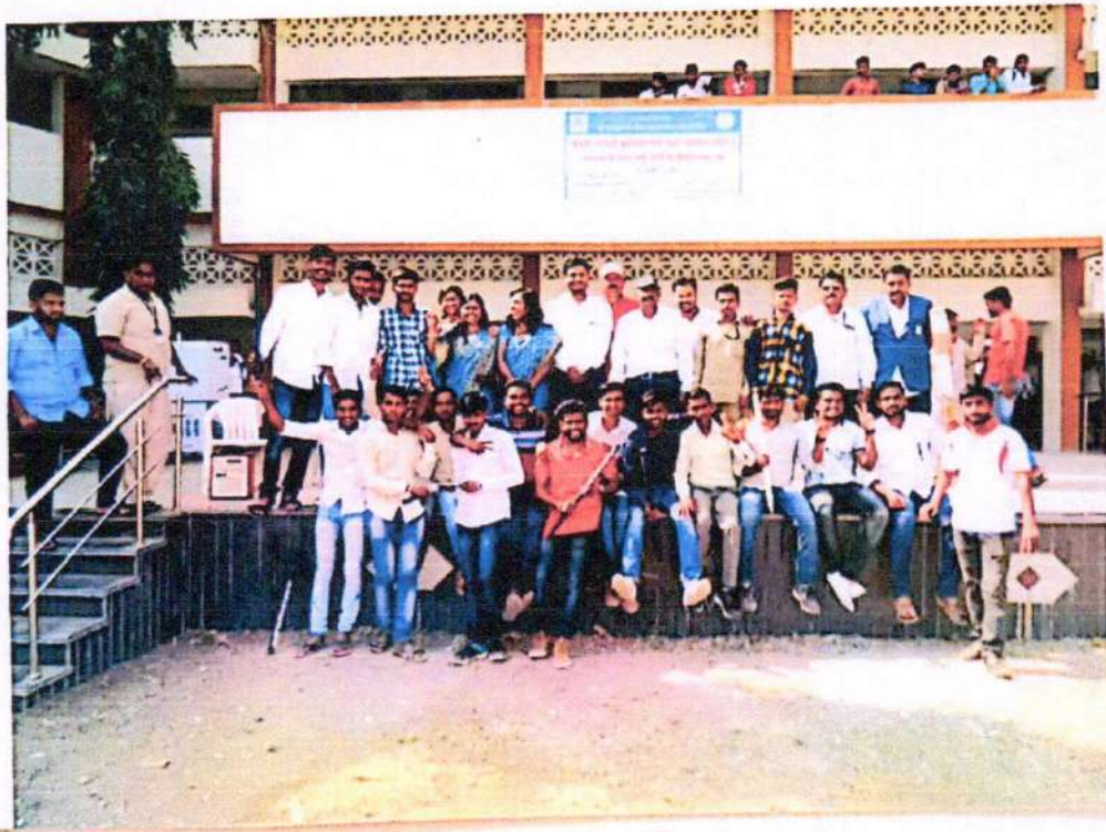
वार्षिक स्नेहसंमेलन 2020 - क्रिकेट स्पर्धा संपन्न झाल्यानंतर विजयी क्रिकेट संघासोबत महाविद्यालयचा स्टाफ.