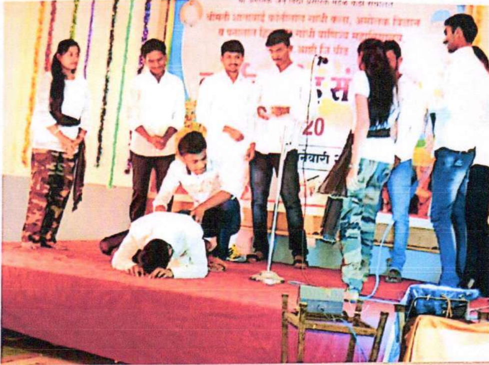
वार्षिक स्नेहसंमेलन 2020 - महाविद्यालयी विद्यार्थी नाटक कला प्रकार सादर करतेवेळी.