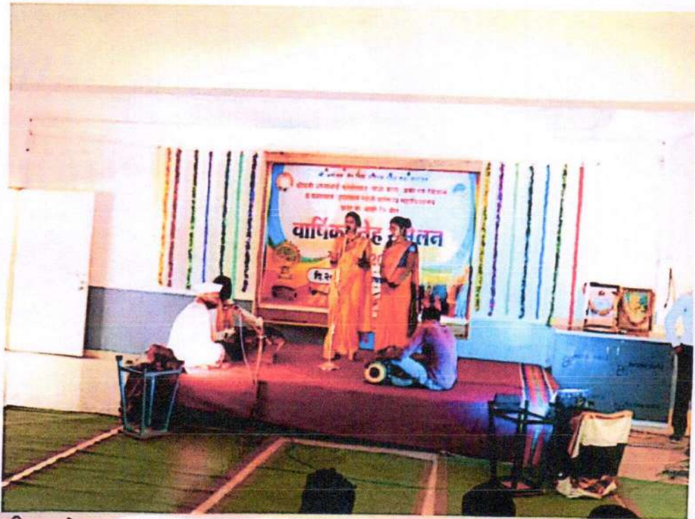
वार्षिक स्नेहसंगमेलन-2020 - समुह गायन गानेवेळी म्हाविद्यालयाने विद्यार्थिनी