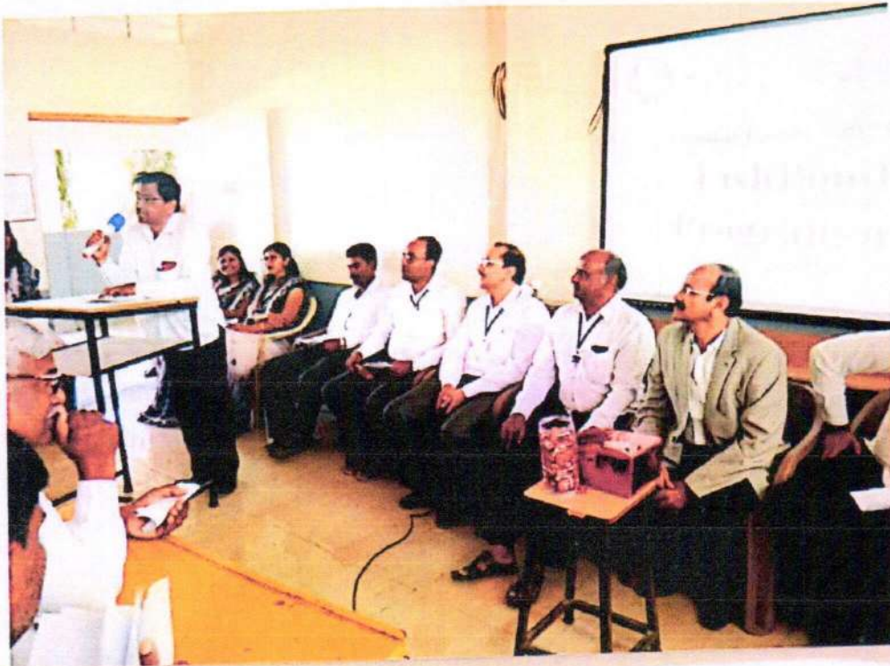
वार्षिक स्नेहसंमेलन 2020 - शेलापागोटे कार्यक्रम संपन्न.